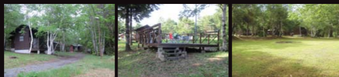
バンガロー デッキ付(約15㎡) 6棟