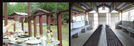
バーベキューサイト