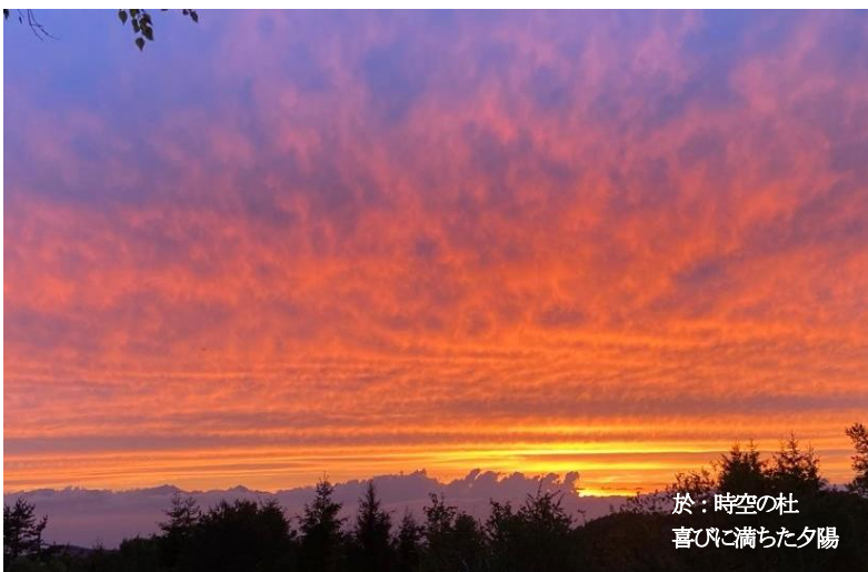
於：時空の杜 喜びに満ちた夕陽

2015 年時空の杜をオープンさせ、2019 年からはソースリトリート(自己の根源に気づき生きる)時空の杜として、「自己を生きる」ための気づきに注力して、様々なプログラムを実施している。