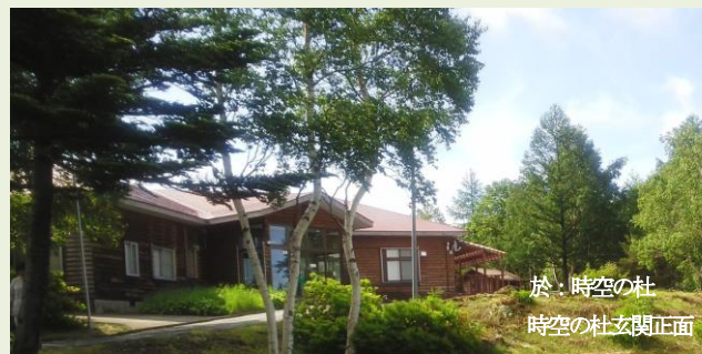
於：時空の杜 時空の杜玄関正面